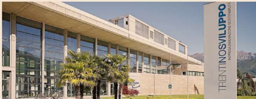
Polo di ricerca e innovazione. La sede di Trento Sviluppo. I suoi spazi riuniscono startup, scuole, imprese storiche e centri di ricerca pubblici e privati

In soli dieci anni la quota di laureati della regione ha quasi raggiunto la media europea: oggi l'area dispone di capitale umano qualificato e adatto a sostenere le imprese davanti alle sfide della trasformazione digitale